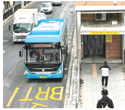
投运的新能源车辆。

本报讯(奔流新闻·兰州晨报记者张艾萍)12月10日，50台中国中车牌TEG6125BEV11型纯电动公交车正式分批投入兰州BRT——B1路、B2路运营，标志着兰州快速公交系统迎来新一轮车辆升级。此次投运的新能源车辆将逐步替换已运营近13年的旧款客车，为市民带来更绿色、舒适、高效的公共交通出行体验。