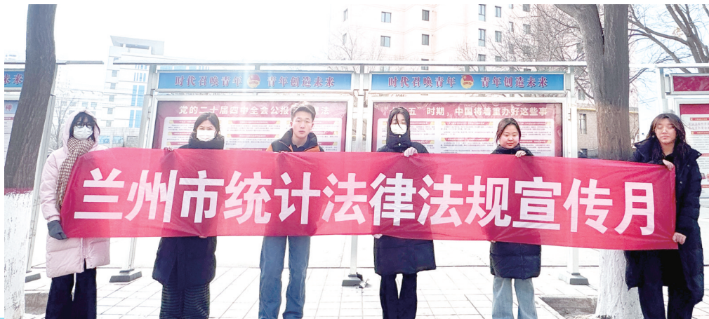
活动现场。

活动现场，志愿者通过设立咨询台、布置宣传展板、发放普法资料等多种形式，向师生们普及《中华人民共和国统计法》的核心内容，深化了师生们对统计工作科学性、严谨性和权威性的认识。