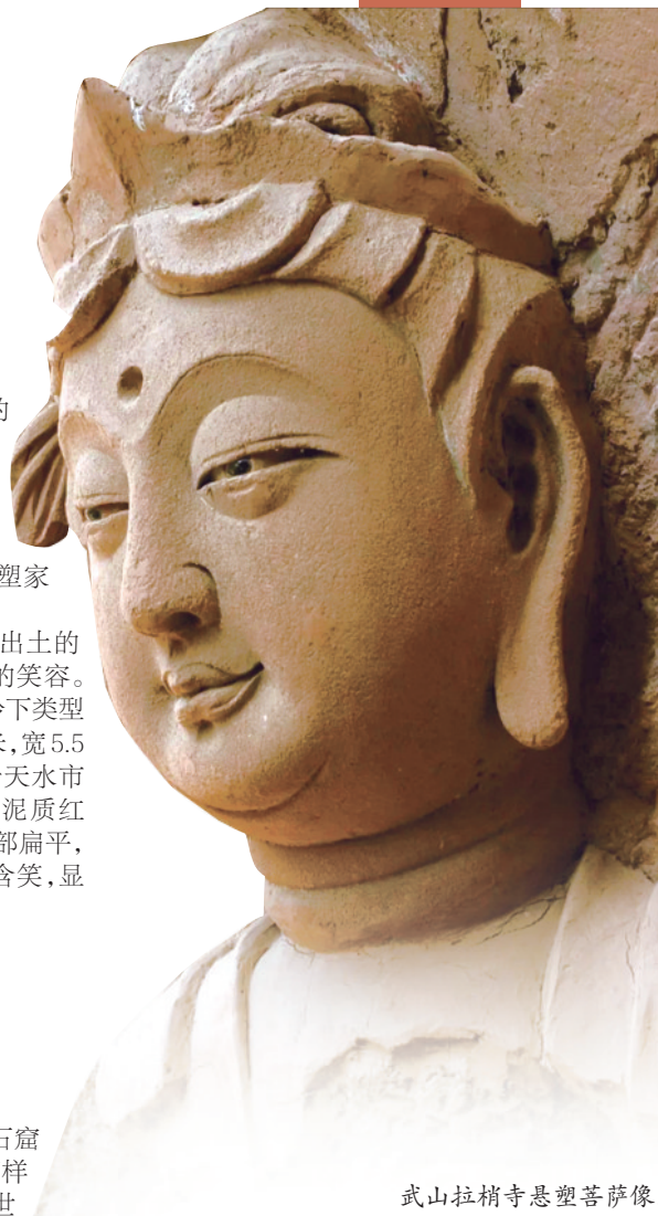
武山拉稍寺悬塑菩萨像。