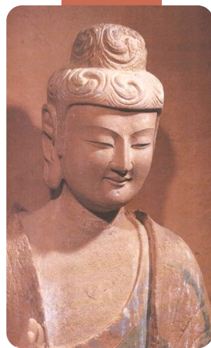
麦积山石窟第133窟正壁主尊造像。