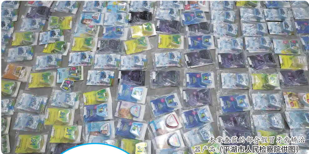
本案查获的部分假冒牙齿矫治器产品。

近期,浙江查获一条分布全国多地、涉案金额近千万元的假冒进口牙齿矫治器的黑色产销链。记者采访发现,一些犯罪分子盯上了儿童口腔正畸治疗领域,以“低价平替”掩盖制假贩假,误导不少家长网购不合格产品。办案机关、口腔科专家共同提醒:事关儿童口腔健康,选购矫治器这事儿,要较真!