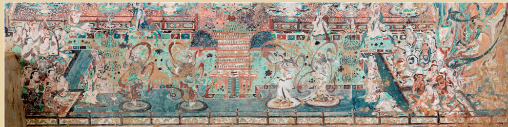
莫高窟第220窟北壁,舞乐图。

敦煌,是中国的,也是世界的。她凝聚着人类对美的共同追求,对永恒的不懈探索。《读者·海外版》(敦煌号)不仅向世界展示了现代敦煌文化的独特魅力,也推动了中华文化在国际舞台上的传播和交流。