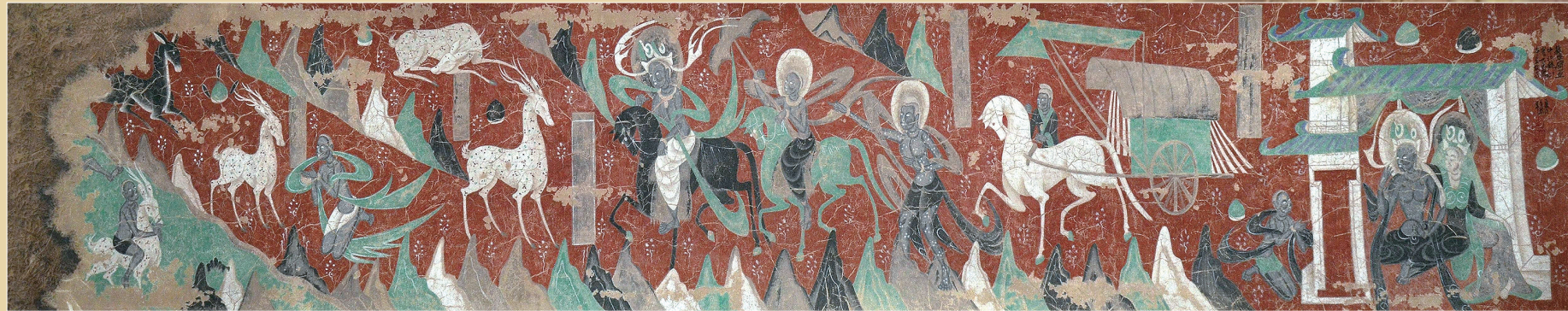
莫高窟第257窟,鹿王本生,北魏。