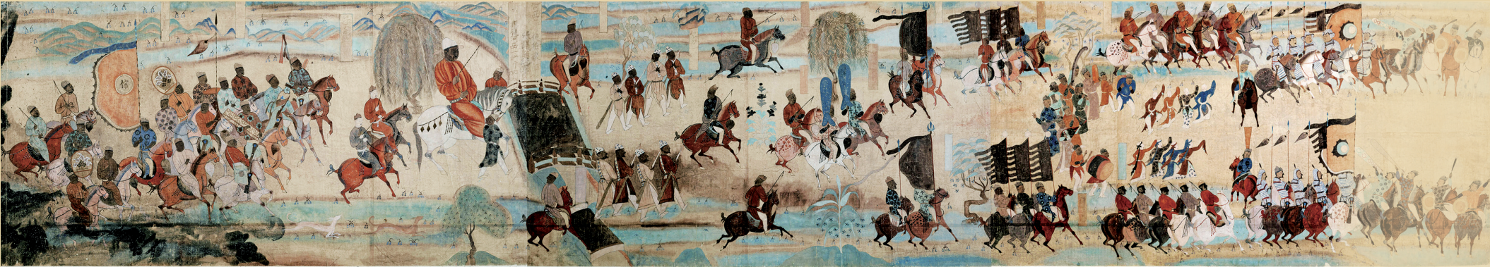
莫高窟第156窟,张议潮统军出行图,晚唐。 段文杰 整理临摹