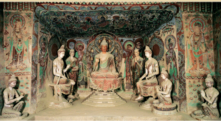
莫高窟第328窟,彩塑一铺,初唐。