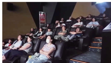
普通座椅“迭代”到按摩椅。

当传统的运营模式被打破,影院的跨界玩法还有很多。在位于兰州新区的西北首家餐厅式影院,观众在欣赏最新影片的同时,还能够品尝东南亚融合菜品和西式简餐。随着越来越多的观众对新观影场景的认可与接受,今年暑期,影院观影人次已超过2万,同比提升25%。