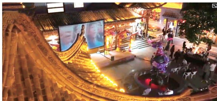
临夏八坊十三巷露天电影公益放映点。