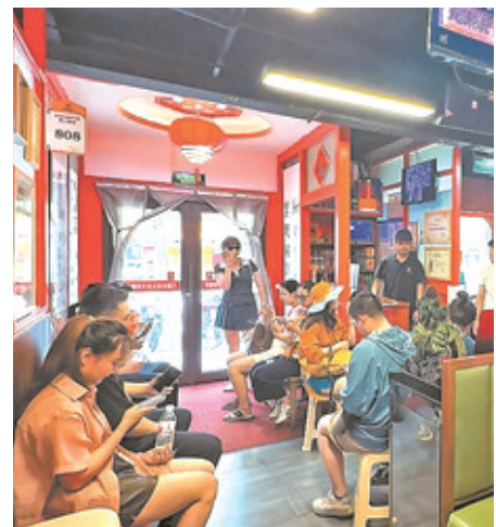
周末火锅店里等位的食客。