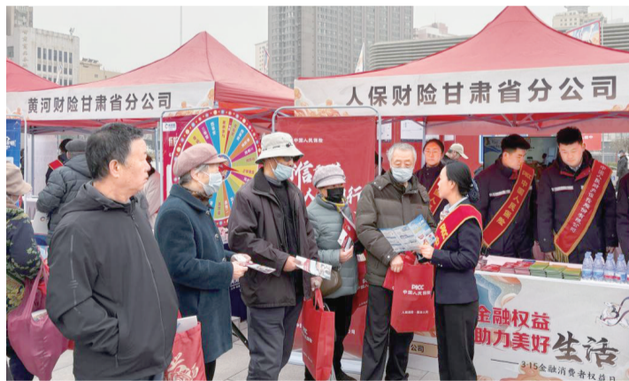
公司人员现场向中老年消费者宣传讲解金融消保知识。

面对2024年多场重大暴雨、洪涝灾害,人保财险甘肃省分公司党委统一指挥,各个基层党支部积极响应和落实防汛救灾工作部署,第一时间成立党员突击队,开启理赔绿色通道,按照“应赔尽赔、能赔快赔、合理预赔”的工作要求,简化管理流程,提供接报案和理赔救援指引服务,确保民生类保险事故损失及时赔付到位,帮助受灾群众恢复生产生活,以实际行动践行金融央企的政治性和人民性。