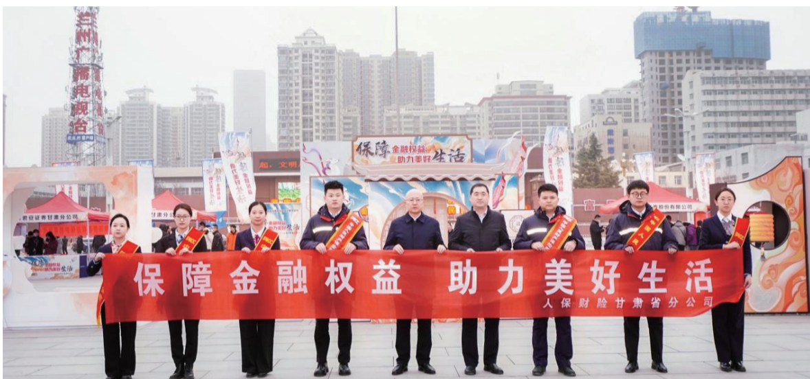
人保财险甘肃省分公司开展“3·15”金融消费者权益保护教育宣传活动。

在“一带一路”建设中,助力金川集团等企业“走出去”,为海外业务提供风险保障,展现中国保险力量。