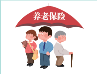
城乡居民养老保险 和60岁及以上老年人 意外伤害保险项目