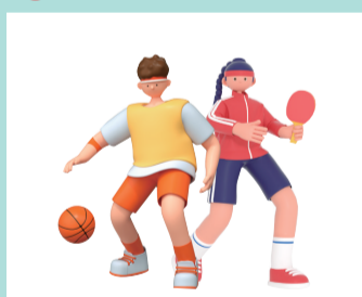
全民健身中心提升改造项目