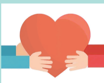
“失独”家庭综合保险项目