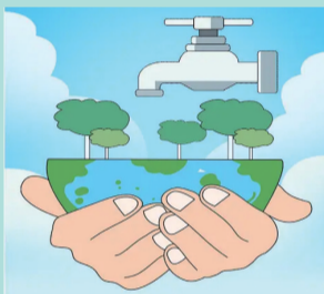
农村山区515户居 民饮用水水质提升项目