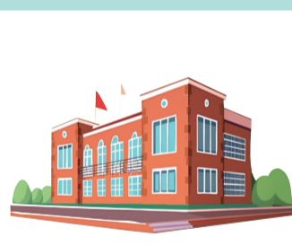
城区新增学位项目