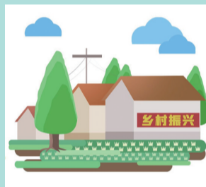
乡村振兴示范带建设项目