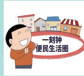
新建“一刻钟便民生活圈”项目