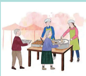
社区嵌入式养老助餐 服务设施建设项目