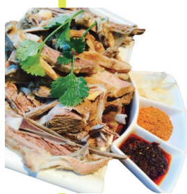
品尝特色美食。门源回族自治县的壮丽雪山岗什卡雪山，在岗

“甘肃小记者成长计划”已经持续进行了四季，今年寒假，“甘肃小记者成长计划”第五季全新升级，开启异地之旅。小记者们将穿越青海藏文化博物馆的千年时光，感受藏族服饰的绚丽与藏医药的神秘；将踏入青藏高原野生动物园的奇妙世界，与雪豹、大熊猫等高原精灵共舞，探寻大自然的奥秘与生命的多样性；将站在雪山脚下，仰望那高耸入云的山峰，仿佛一座神圣的殿堂，登顶之时，俯瞰苍茫大地。