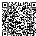
扫二维码 参与报名