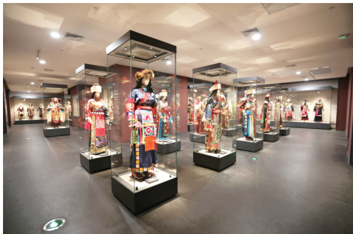
了解民俗服饰文化。

当寒假的脚步悄然临近，这个寒假你们的愿望是什么？漫漫长假，如何让孩子们在放松的同时又能过得充实有意义呢？甘肃小记者团寒假营活动应该是个不错的选择！即日起，“甘肃小记者成长计划”第五季全新升级火热开启，让我们一起走进青海，探秘高原奇境，邂逅雪域精灵，在行走的路上打开世界的大门，带着一颗童心，探索、发现、成长，收获不一样的自己。