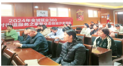
创业沙龙授课现场。

为赋能辖区居民创新创业，激励辖区居民群众的就业创业能力，近日，兰州市城关区铁路东村街道开展“金城就业360”服务之家创业沙龙活动，吸引辖区30余名有创业意向的居民参与。