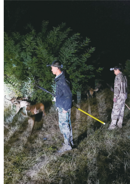
猎捕队凌晨追捕野猪。

尽管如此，也没有影响到队员们的狩猎心情。狩猎队是纯公益性组织，很受当地政府及村民欢迎，除了受村民和林草部门邀请去一些指定地点进行猎杀野猪行动，狩猎队也会自行前往狩猎，平均下来狩猎队一周会出动三四次。“成立两个多月来，共猎捕20多只野猪。”