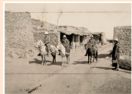
1924年4月24日，安特生团队在从兰州前往临洮的途中合影。