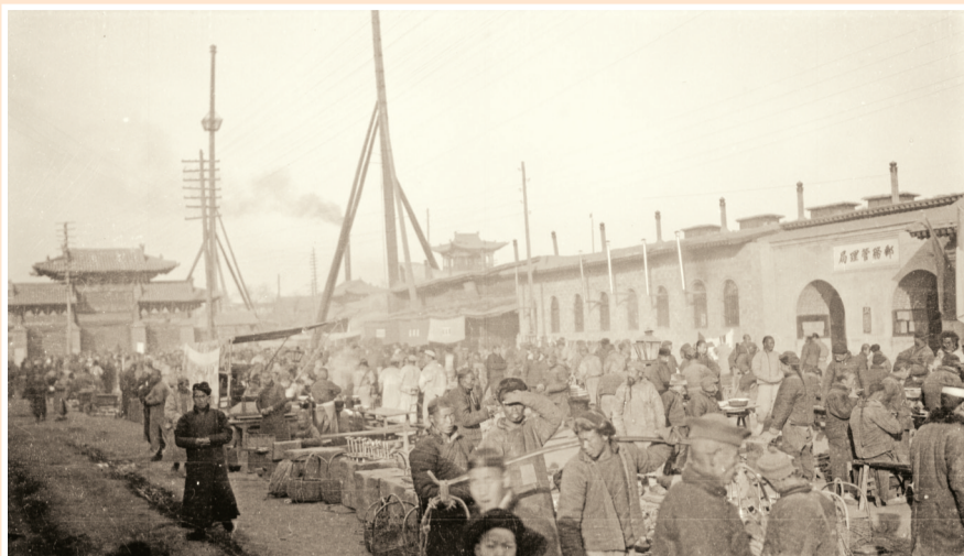
1923年12月24日拍摄的兰州城集市。