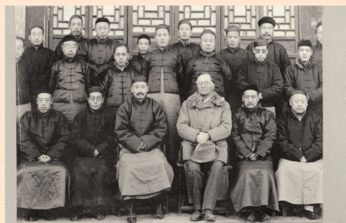
安特生先生(右一)与在兰州的外籍人士留影。