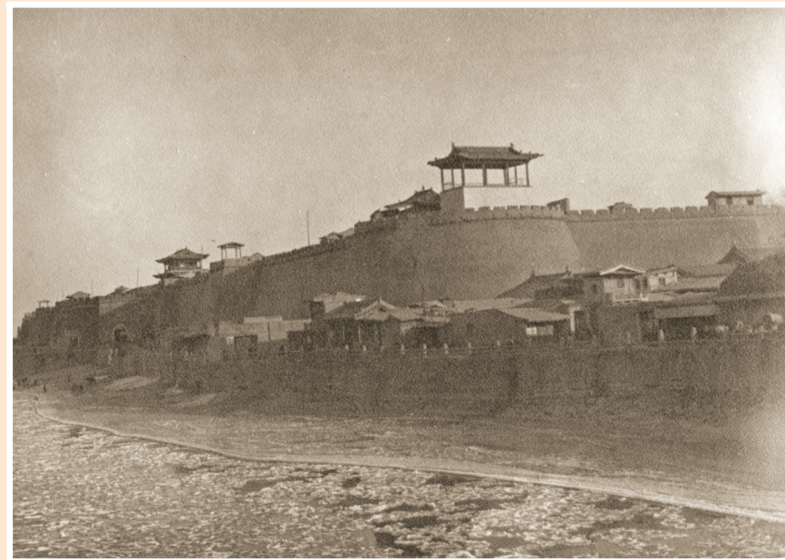
兰州城墙和黄河冰凌。