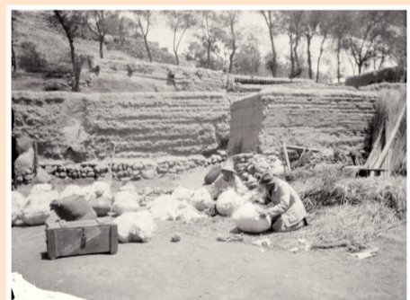
科考队在临洮辛店打包陶罐。