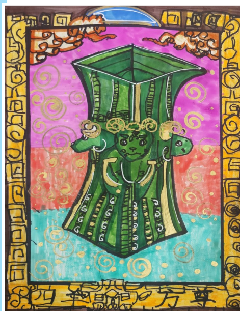
《四羊方尊》 李骥玉 兰州市七里河区火星街小学一年级