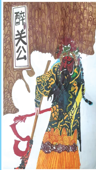
《醉关公》 刘书淳 兰州市火星街小学一年级1班