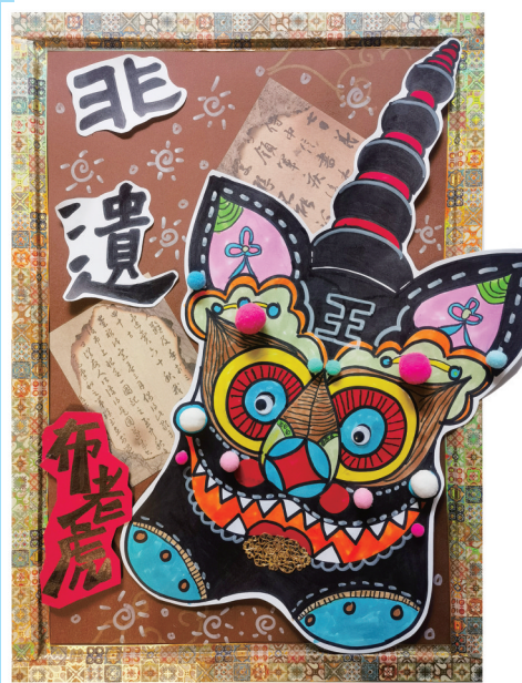
《布老虎》 李瑞宸 兰州市火星街小学二年级4班