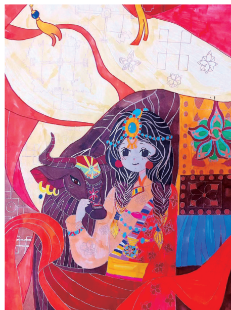
《藏族少女与牦牛》 杨馨蕊 兰州市志成中学高一1班