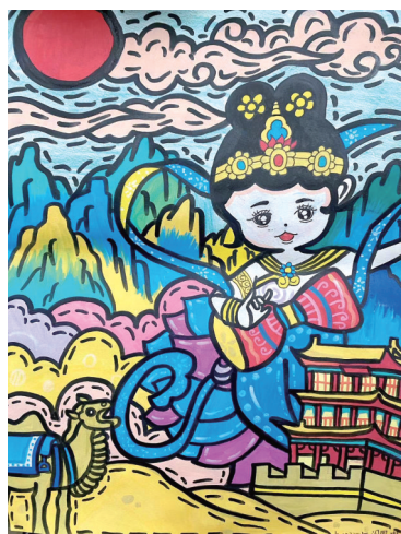
《敦煌之韵》 闵思琪 陇南市徽县第四中学七年级22班