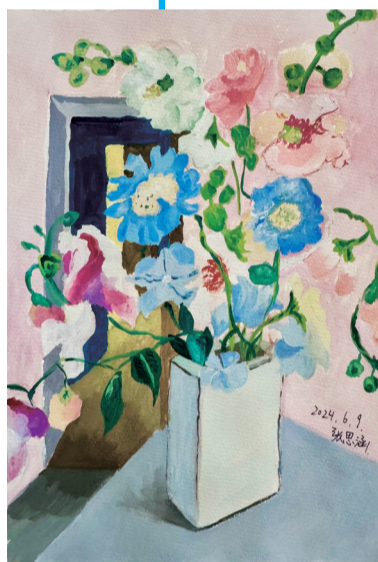
《花语》 张思涵 13岁 艺之邦美术教育