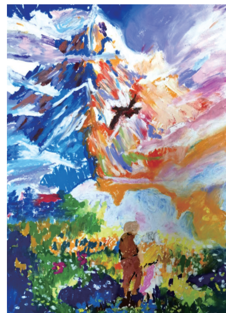
《海蒂和爷爷》 柳元宁 8岁 艺之邦美术教育