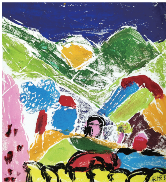
《微风徐来》 来欣瑶 8岁 艺之邦美术教育