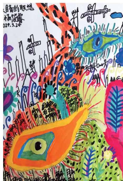
《眼的联想》 杨简睿 7岁 艺之邦美术教育