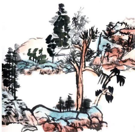
《江远清妙》 李玥彤 9岁 艺之邦美术教育