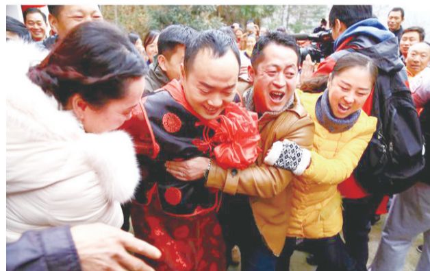
康县女娶男嫁婚俗——「抢」新郎。

由于康南属于陕甘川三省交界地带，历史上周边地区兵燹不断，四川、河南、陕西的青壮男子，为躲避战乱，纷纷来到康南这块相对封闭的区域，有一部分人，自己设法安家落户，绝大多数人被招赘上门，定居于此。就这样，彼此引荐，世代相传，渐渐形成了女娶男嫁的婚俗。