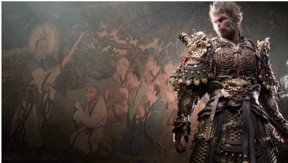
《黑神话：悟空》游戏中悟空的形象。

这个备受期待的“悟空”，究竟是从哪“蹦”出来的？在技术突破之外，它还实现了什么？