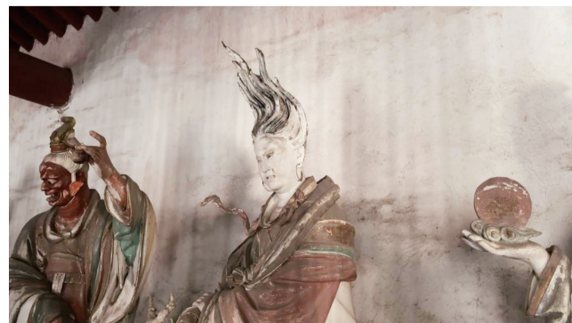
二十八星宿殿内的元金龙彩塑。