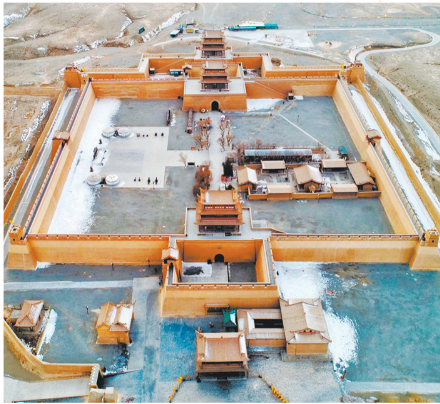
俯瞰嘉峪关关城。

从光化门、柔远门到嘉峪关门，砖砌拱券式门洞，一字排开，正好囊括了关口的雄姿，春夏秋冬景致各异，就像一个画框，妙笔生辉。