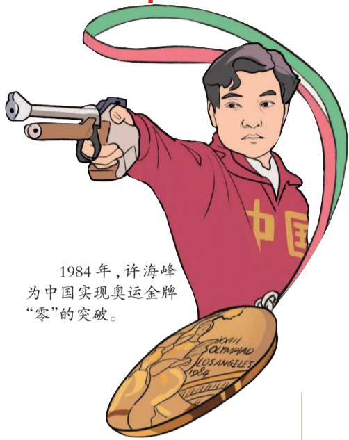
1984年，许海峰为中国实现奥运金牌“零”的突破。