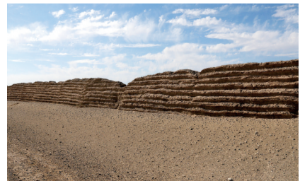
敦煌汉长城遗址。