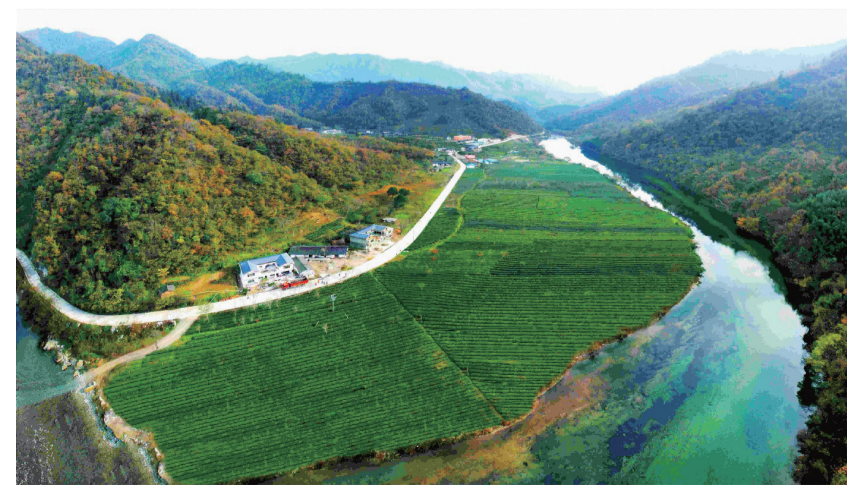
康县阳坝景区梅园沟茶园。

“中国最美县域”是个不受商业因素影响的公益动态榜单，秉持“发现美”的榜单宗旨，由深圳市中元品牌价值研究中心和中县智库共同研发的《中国最美县域品牌价值研究报告（2023-2024）》蓝皮书同期发表。