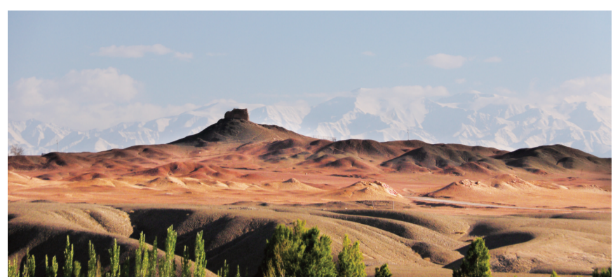
阳关遗址。

“渭城朝雨浥轻尘，客舍青青柳色新。劝君更尽一杯酒，西出阳关无故人。”这是唐代诗人王维的《送元二使安西》，又名《渭城曲》《阳关三叠》。千百年来，这首中国文学史上咏叹离别之情的诗句，使阳关名扬四海，声震五洲。诗中提到的阳关就在敦煌，位于市区西南70公里处的阳关镇。