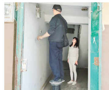
在老旧小区安装声控灯。