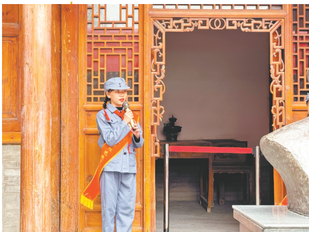
少年变身红色教育小小讲解员。