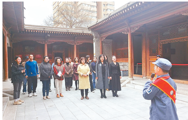
小小讲解员向游客介绍红色故事。

“当一名讲解员对我们来说不是一件容易的事儿，我们要来纪念馆对着展厅陈列物品熟悉讲解词。在这里，我们不仅学会了专业的讲解知识，而且更深刻地了解了红色历史，也更坚定了我要好好学习的决心。”两位小小讲解员表示。