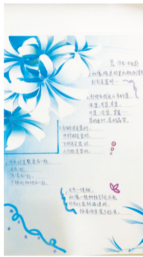
四年级小学生的语文作业。