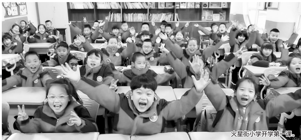
火星街小学开学第一课。

时光恰好、初春相遇。2月26日,兰州市中小学迎来了2024年春季开学日。伴着春雪,兰州市各学校精心准备了仪式感满满的“开学礼”,欢欢喜喜的舞龙舞狮、寄托着美好祝福的寄语墙、创意十足的祝福“愿”红包等都是为了迎接学子们的归校。孩子们带着新学期的希望“龙”重登场,在期待与祝福中开启新征程。