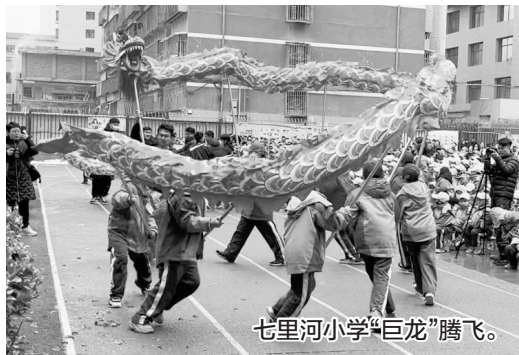
七里河小学“巨龙”腾飞。