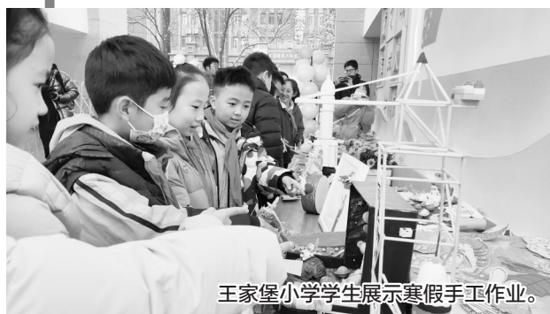
王家堡小学学生展示寒假手工作业。