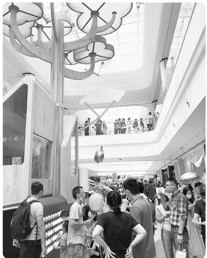
排队等候进入网红餐厅就餐的消费者络绎不绝