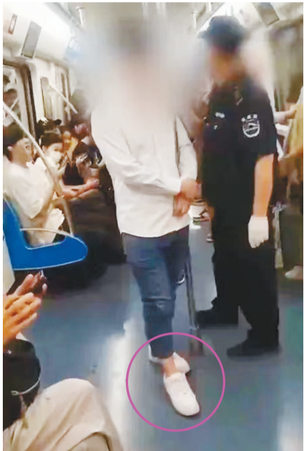
被疑“偷拍”。

本报讯(奔流新闻·兰州晨报记者张鹏翔)12月12日,奔流新闻·兰州晨报记者从成都铁路运输第一法院获悉,备受关注的“成都地铁偷拍事件”当事男子维权一案一审宣判。法院判决认为,两女子不构成对当事男子的一般人格权的侵权。