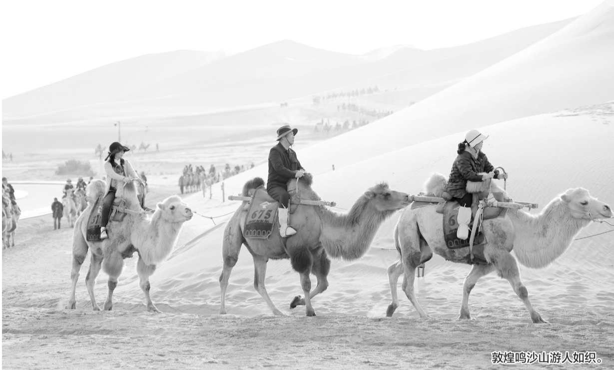
敦煌鸣沙山游人如织。

11月13日,省政府印发《关于释放旅游消费潜力推动旅游业高质量发展的实施方案》(以下简称《实施方案》),从丰富旅游产品、激发旅游消费活力、提升入境旅游服务质量、强化安全监管等方面入手制定了22条具体要求,为提振旅游消费市场给予强有力的政策支持,争取全省旅游人数和旅游综合收入年均增长分别保持在25%和30%以上。