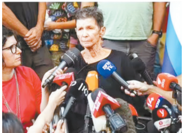
85岁的利夫希茨在记者发布会上。