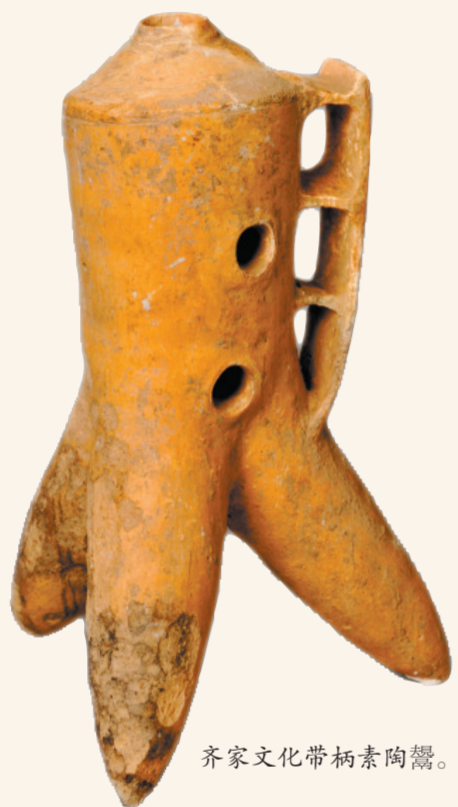
齐家文化带柄素陶鬲。