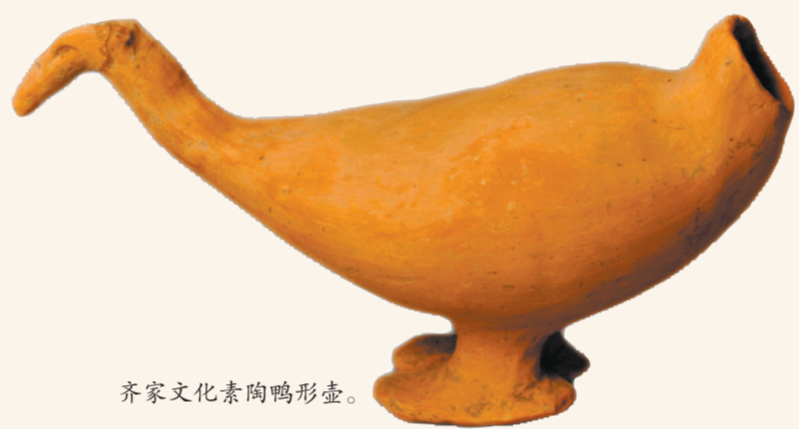
齐家文化素陶鸭形壶。