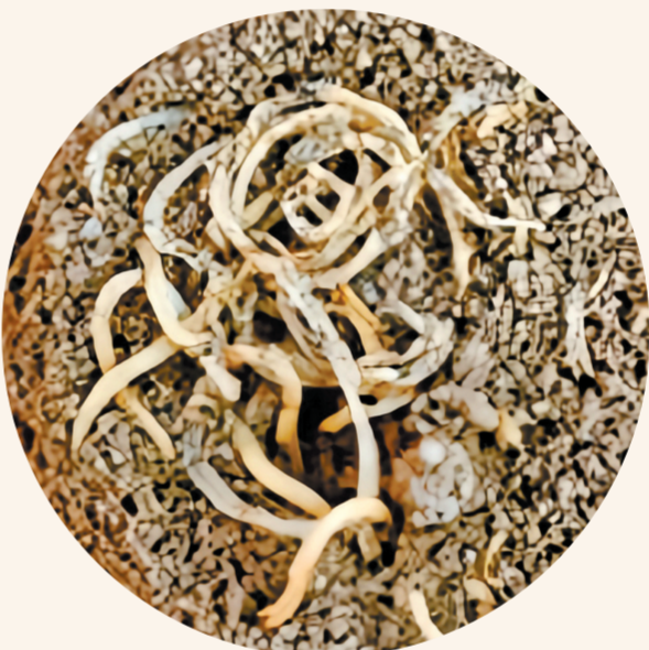
喇家遗址出土的面条残存物。