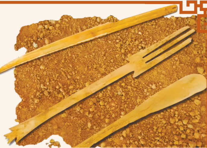
宗日遗址出土的骨制餐勺餐叉餐刀。

在甘肃武威市皇娘娘台齐家文化遗址,也曾出土一件骨质餐叉,为扁平形,三齿。众多餐叉都出土于西北地区,说明这里可能是餐叉起源的一个很重要的地区。