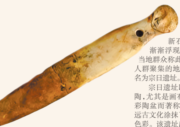
临泽陈旗齐家文化墓地发现的骨匕。