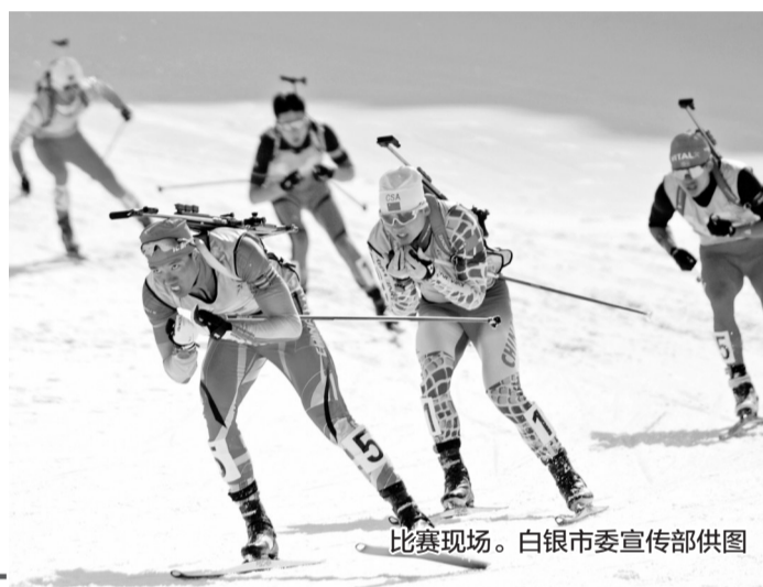
比赛现场。

市政府、省体育局承办。大赛共设置3个大项11个小项共11枚金牌,自2月19日开赛至今,大赛已产生8枚金牌。在明后两天的男子4×7.5公里接力、女子4×6公里接力和混合接力项目,各代表队将争夺最后3枚金牌。