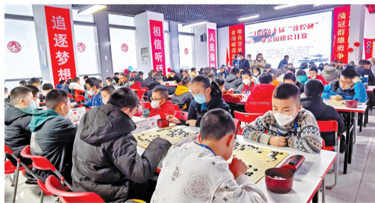
参赛小选手在比赛中。

据了解,此次赛事为成人棋手提供切磋棋艺、以棋会友的机会,创造了享受围棋快乐对弈的平台,也给青少年棋手提供了一个提高棋艺、锻炼提升的机会。