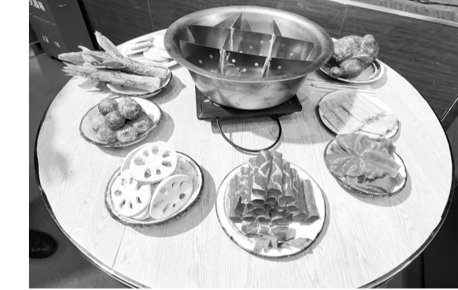
惟妙惟肖的“火锅盛宴”。

胡麻岭隧道是兰渝铁路的头号重难点工程,歌剧《不遥远的胡麻岭》讴歌了中国铁路建设者的愚公移山精神和大国工匠精神,为了还原胡麻岭隧道