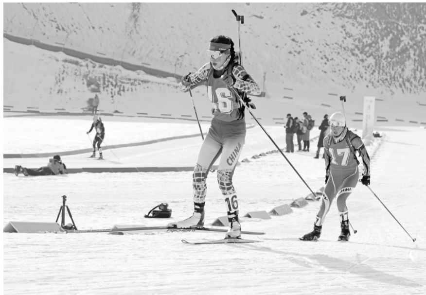
全国冬季两项冠军赛,在白银国家雪上项目训练基地开赛。

本次赛事举办场地为甘肃白银国家雪上项目训练基地,基地占地面积1034.30亩,有越野滑雪赛道、冬季两项训练