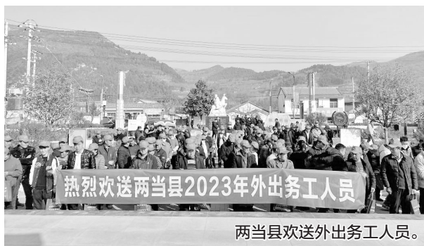
两当县欢送外出务工人员。

新甘肃·甘肃日报记者 王占东 杜雪琴 曹立萍 蔡文正 洪文泉 王煜宇 苏家英 张燕茹 顾丽娟 李永萍