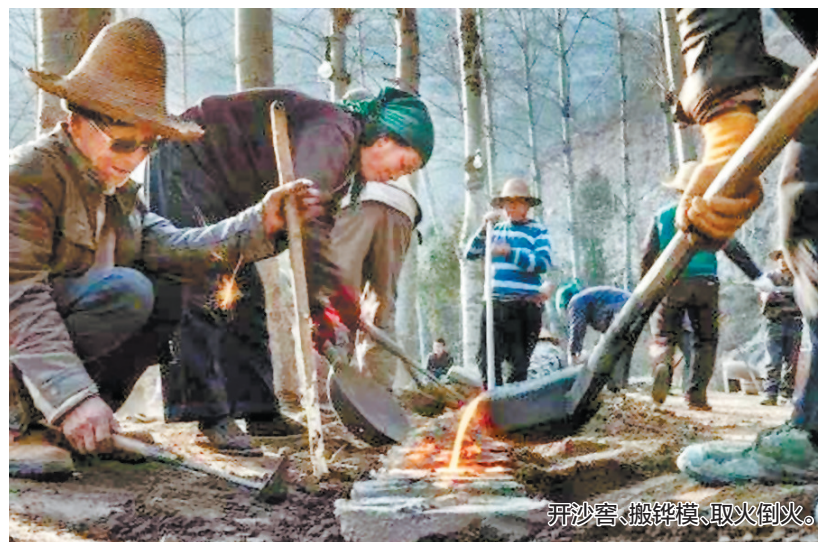
开沙窖、搬铧模、取火倒火。