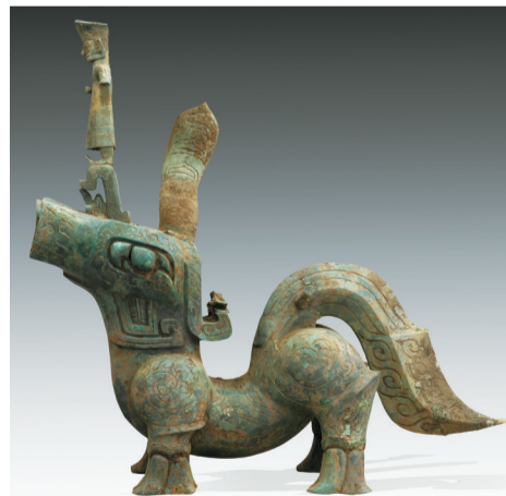
这是8号“祭祀坑”神兽(资料照片)。