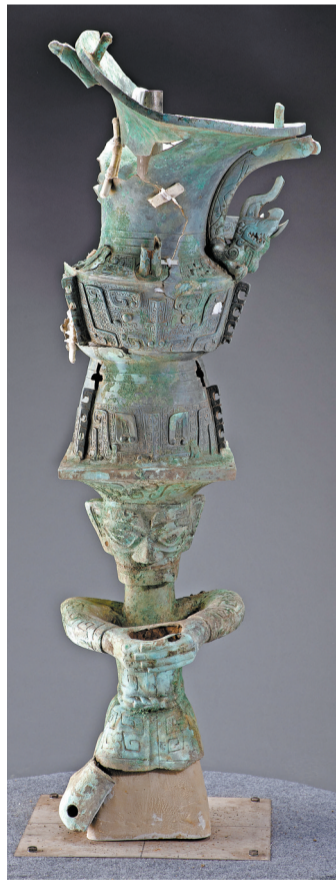
这是3号“祭祀坑”铜顶尊跪坐人像(资料照片)。