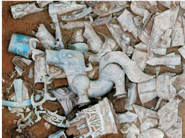
这是在8号“祭祀坑”出土的神兽(资料照片)。