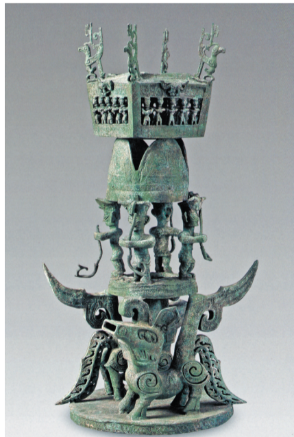
这是1986年三星堆2号“祭祀坑”出土的铜神坛(资料照片)。