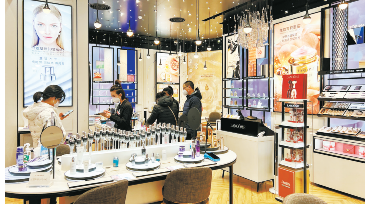
市民在兰州中心购物。