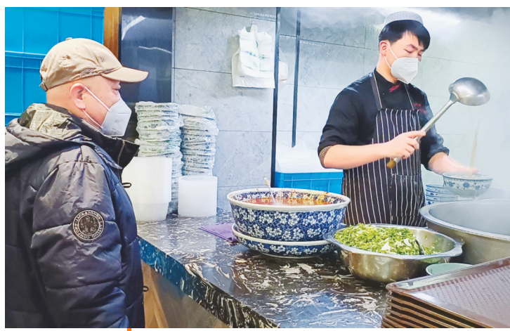
牛肉面馆正常营业。

“商场陆续开门、牛肉面馆开始营业、快递外卖恢复、乘坐地铁、火车不再查验核酸检测阴性证明……”全是好消息,条条鼓舞人心。