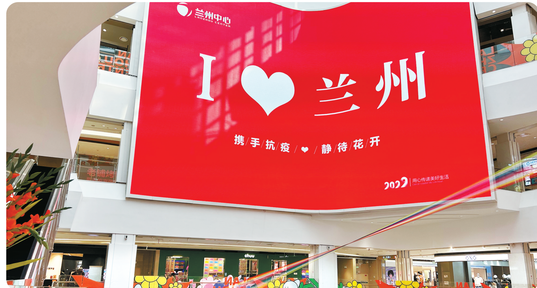
随着生活逐步恢复正常,我们对兰州的爱又增加了几分。