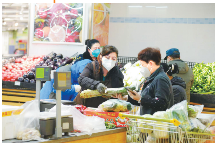
顾客在华润万家超市临夏路店选购蔬菜。

街道上街坊邻居问好的声音,汽车来往穿梭的声音,商家开始叫卖的声音,不绝于耳,一切都活络了起来。