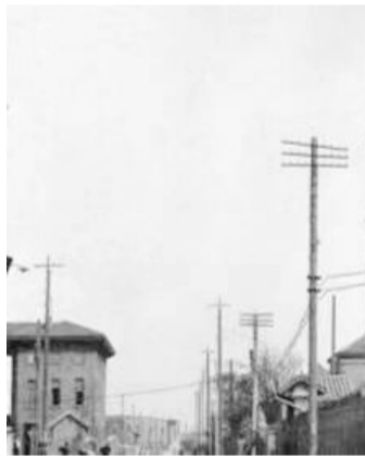
最早栽设的木头电线杆。

世事沧桑,甘省几变。百年前的有线电杆保障了有线电报的传递。而今,进入了网络时代,对西北僻地传播信息、开风气之先起到至关引领作用的电报也销声匿迹,退出了历史舞台。奔流新闻·兰州晨报特约撰稿 姜洪源