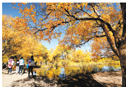
金塔胡杨美如画。