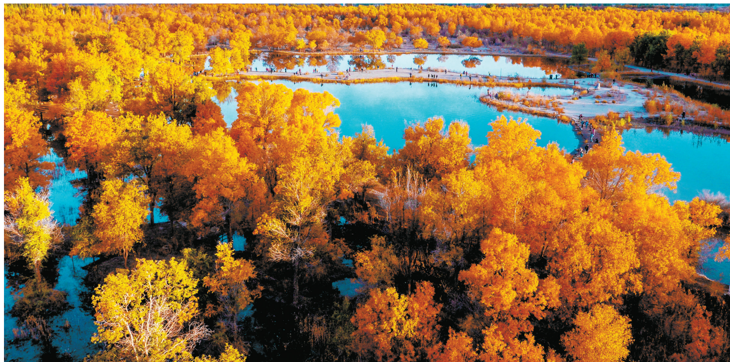
鸟瞰金波湖。