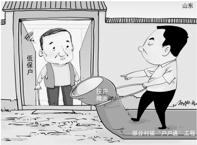
按户摊派

“现在一提这个路就烦心。”在山东省平度市旧店镇杏庙村，督查组一提“户户通”立刻就打开了村民们的话匣子。 在杏庙村，记者看到一个奇怪的现象：处于一条巷子里的道路，状况大相径庭，有的家门口硬化了，有的却是土路。一些村民戏称就像“钢琴路”，一块黑一块白。 村民说：“交了钱的就给修了，还没交钱的就不给修。” 在山东省安丘市景芝镇戴家沙湾村，督查组同样看到了“钢琴路”。督查组到达这个村时，恰逢当地下雨，走在“户户通”工程的路上，硬化路、泥土路交错，一场雨过后，走起来鞋子照旧沾满泥巴。 还有一些村民反映，没修前，路还算平顺，修完后出现雨水倒灌。莱西市店埠镇的一些村民反映，由于新修道路路基下挖深度不够，硬化后路面比硬化前高出不少，村民家院子里的雨水流不出来，一下雨就会倒灌。为了挡水，村民不得不自制围挡或干脆挖排水沟。