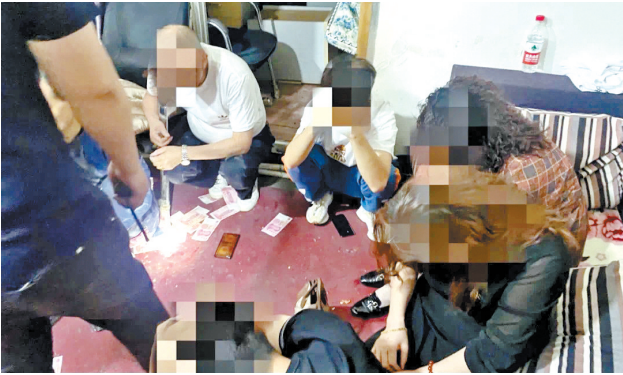
地下赌博窝点被捣毁。

本报讯(掌上兰州·兰州晨报通讯员樊奕昕 记者张秀芸) 抓获开设赌场及参赌人员25人,查获赌资28万余元……9月1日凌晨,在省公安厅、兰州市公安局等相关部门的指导和大力支持,城关公安分局合成作战中心、治安大队等相关部门相互协作,成功捣毁一地下赌博窝点。